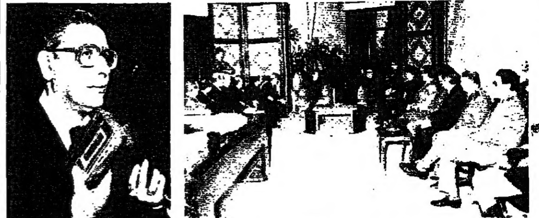
المستشار أبو حرملة